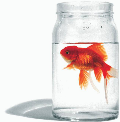
Optimal geschützt?