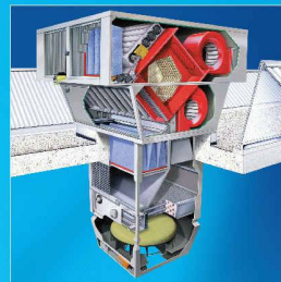
RoofVent® LHW. Das Dachlüftungsgerät mit Wärmerückgewinnung.