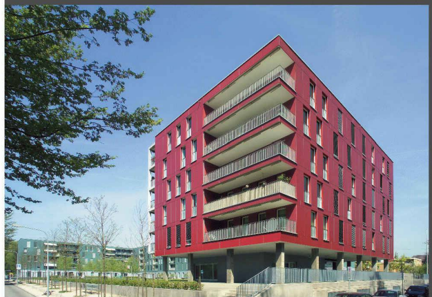
Architekten: Tina Arndt, Daniel Fleischmann, Zürich

Die Wahl des Materials als entscheidendes Element einer kon- sequenten Umsetzung. SWISSPEARL Faserzementplatten verleihen dem gestalterischen Konzept ein Gesicht. Mit einzigartiger Ausdruckskraft.