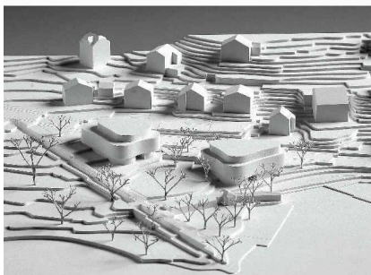
Fallende Dachfläche (3. Rang, weberbrunner)