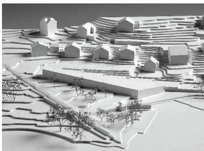
Abgerundete Dreiecke (4. Rang, Ernst Gerber)