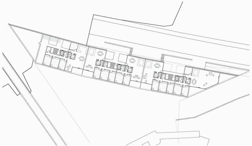
Die Mauer wird entlang der Staatsstrasse weitergeführt. Ansicht Strasse, Modellbild und Grundriss Ebene 2 (1. Rang, Aebi & Vincent)