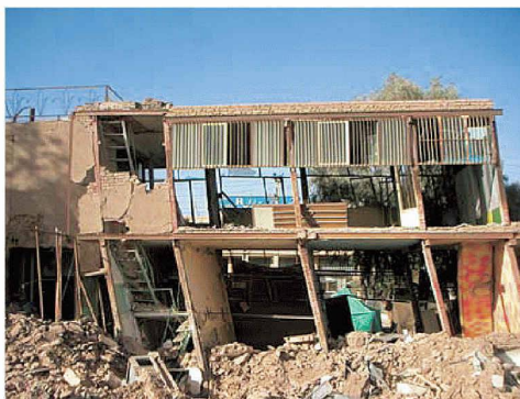
Ein bestehender Bau, der auf das Erdbeben wie ein Kartenhaus reagierte

René Guillod, Bauingenieur SIA, Basel, guillod@wgsp.com