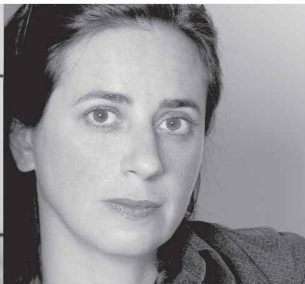
India Mahdavi, Paris