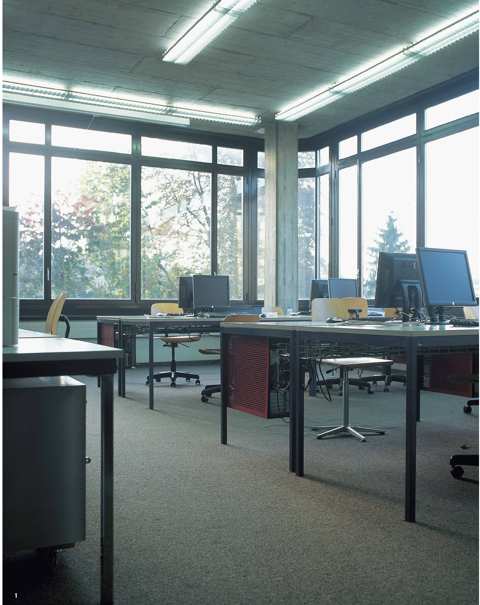
1 Computerarbeitsraum der Studierenden mit fest installierten PC-Stationen