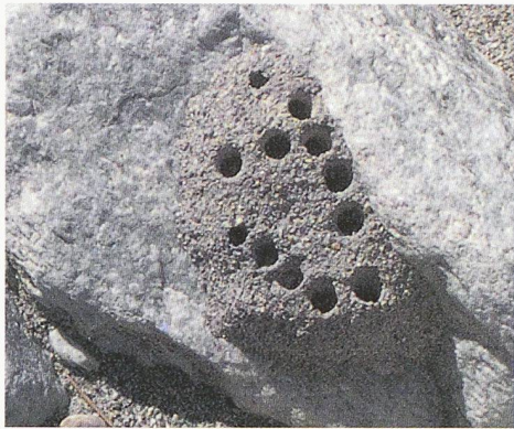
Nest der Mauerbiene: Die meisten der 20 hier vorkommenden Bienenarten hätten mit dem ursprünglichen Konzept ihre Lebensgrundlagen verloren

den Pfywald noch mehr beeinträchtigt. Der Widerstand verschiedener Naturschutzkreise bewirkte vorerst einen Planungsstopp. Erst 1980 legte der Kanton Wallis ein neues Konzept vor, das die Autobahn parallel zur Kantonsstrasse vorsah. Damals begannen die SBB im Zusam-