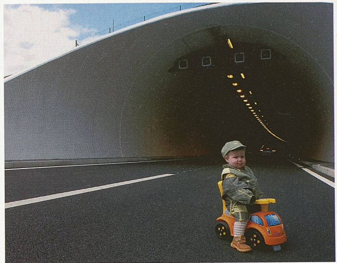
Eröffnung A 5: Autobahnbau ist eine Investition für die Zukunft. Damit spätere Generationen davon profitieren können, muss das Netz sorgfältig unterhalten und weiterentwickelt werden

Die am Bauwerk beteiligten Fachleute, Mitglieder des SIA, dürfen auf ihre Leistungen stolz sein. Als Mitglieder eines Vereins, der seit rund 150 Jahren mit seiner Normierungsarbeit zur hohen Qualität der geplanten Umwelt beiträgt, dürfen sie ihren Stolz zeigen. Mit ihrem stetigen Einsatz bei der Normierungsarbeit tra-