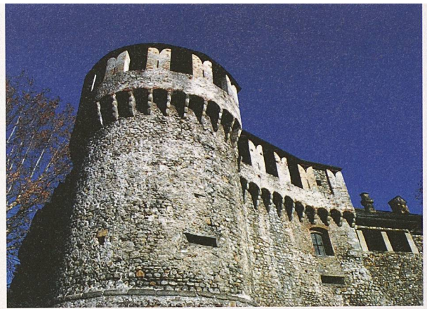
Bollwerk von Schloss Locarno: Wessen Handschrift trägt sein Entwurf? (Bild: key)

Roger Kästle, BILDanstalt GmbH info@bildanstalt.com