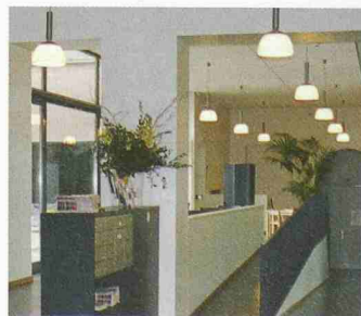
Bei Kindern beliebt zum Spielen: Rollstuhl-Rampe im Restaurant Union in Basel

Broschüre «Hindernisfreie Bauten der Region Basel. Auszeichnungen 2000–2004» bei Pro Infirmis Basel-Stadt, Bachlettenstr. 12, 4054 Basel, 061 225 98 60.