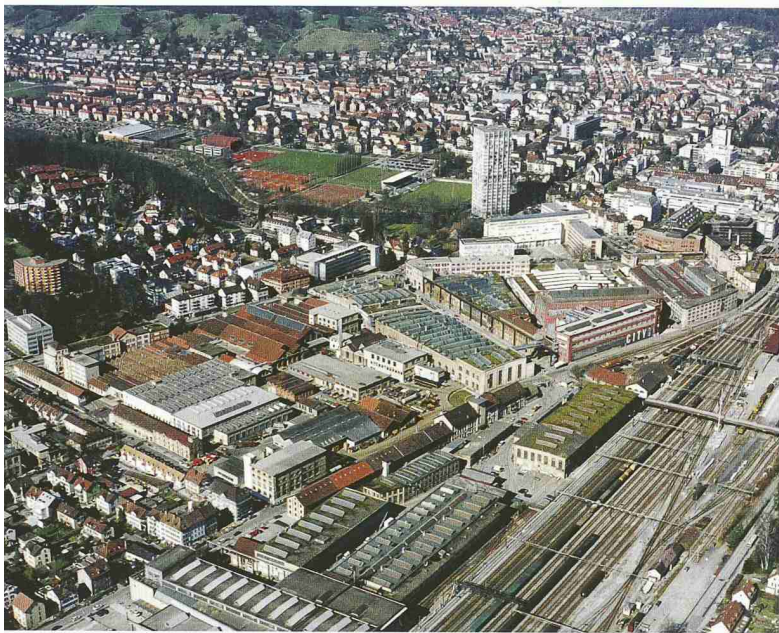
Wegweisend für die Umnutzung von Industriebrachen: das zentral gelegene Sulzerareal in Winterthur