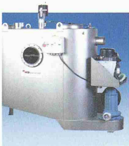
LIPURAT-OAE Fettabscheider mit Entsorgungspumpe

Wir entwickeln saubere Lösungen mit der Natur.