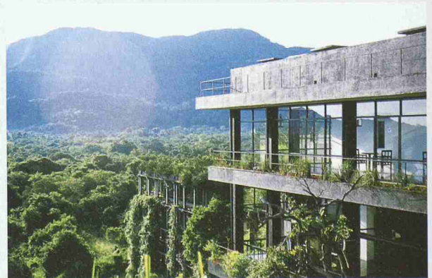
Kandalama Hotel Dambulla (1991) von Geoffrey Bawa. Das Deutsche Architektur Museum zeigt ab 24. Juli die Ausstellung: «Bawa – Genius of the place. An Architect of Sri Lanka.»

Häuser greifen in die Landschaft hinein, die Natur verbindet sich mit einem Bau zu einem eigenen Raum. Geoffrey Bawa starb 2003. Das Deutsche Architektur Museum (DAM) in Frankfurt am Main zeigt in einer grossen Ausstellung erstmals das gesamte Werk Bawas, in Plänen, Fotos, Modellen, Filmen und Möbeln. Die Ausstellung inszeniert das originale Ambiente mit Stoffen, Kunst und Materialien aus Sri Lanka. Sie beginnt am 24. Juli und dauert bis 17. Oktober. Öffnungszeiten: Di–So 10–17 h, Mi 10–20 h. Führungen: Sa + So, 15 h. Infos: www.dam-online.de oder Tel. +49 69 21 23 88 44.