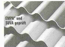
EMPA* und SUVA geprüft DAWANIT Faserzement-Wellplatten in neuester Technologie