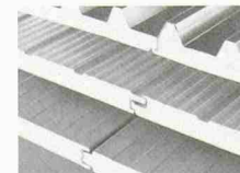
DAWATHERM Isolations-Sandwichpaneelen für rationelles Bauen