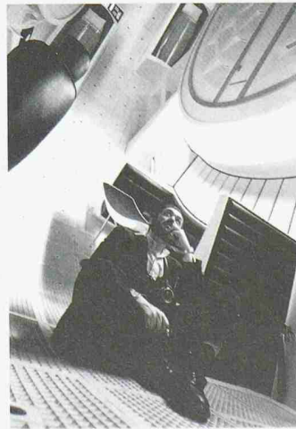
«2001: A Space Odyssey» (2001: Odyssee im Welt-raum, GB / USA 1968). Stanley Kubrick im Inneren des Raumschiffes «Discovery»

setzt wird. Erstmals erhält die Öffentlichkeit Einblick in die Arbeitsunterlagen des Regisseurs zu allen seinen Projekten: Drehbücher, Drehpläne, Produktions-skizzen, Notizbücher, Korrespondenz und Recherchematerialien. Zu sehen sind auch technisches Equipment und Tricktechnik sowie Requisiten und Kostüme. Parallel zur Ausstellung zeigt das Kino des Deutschen Filmmuseums eine Filmreihe mit allen verfügbaren Filmen Kubricks in der Originalversion. Weitere Auskünfte: DAM, +49 212 388 44 oder www.dam-online.de.