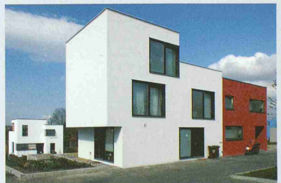
Ein Eckgrundstück des neuen Stadtquartiers in Weimar

tigkeit des Planungsverfahrens im Sinne einer nachhaltigen Stadtentwicklung und Baukultur. Die Ausstellung «Neues Bauen am Horn» im Architekturfoyer der ETH Hönggerberg zeigt unter anderem 25 Modelle von realisierten Bauten sowie von 9 Musterplanungen. Die Ausstellung wird am Mi, 1.12., 18 h, mit einem Vortrag von Adolf Krischanitz im Auditorium E3, HIL, eröffnet und dauert bis 3.2.05. Geöffnet ist jeweils werktags von 8-22 h und samstags von 8-12 h. Infos: 01 633 29 36 oder www.gta.arch.ethz.ch.