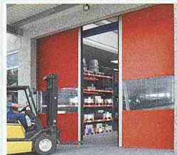
Schnelllauf-tore mit flexiblem Behang