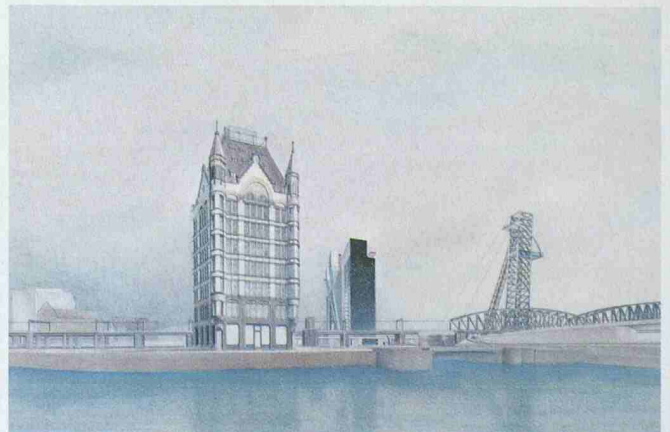
Rem Koolhaas, Wohnhochhaus Rotterdam 1982, Zeichnung, Drawing Archiv / Archiv DAM

und Einflüsse, die sich aus der Debatte um die Postmoderne ergeben haben, baulich umsetzen. Der Begriff «Revision» im Titel der Ausstellung ist somit im Sinne von «Durchsicht» und «Überprüfung» zu verstehen. Die Ausstellung dauert vom 30. Oktober bis 6. Februar 2005. Weitere Infos: Deutsches Architektur Museum, Tel. +49 69 212 38844 und im Internet: www.dam-online.de.