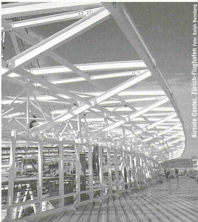
Airside Center, Zürich-Flughafen

Eberhard Unternehmungen, Kloten, Oberglatt, Rümlang, Luzern, Basel Telefon 043 211 22 222, www.eberhard.ch