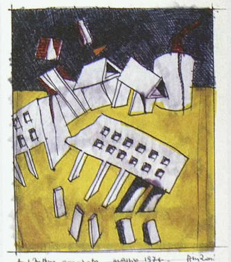
«Architettura Assassinata» von Aldo Rossi

in Modena, aber auch Entwürfe für Rathäuser, Schulen und Wohnbauten werden dokumentiert. Öffnungszeiten: Di–So von 10–17 h, Mi von 10–20 h. Infos: Deutsches Architektur Museum, Frankfurt am Main, +49 69 212 388 44 oder www.dam-online.de .