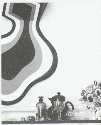
Wohnungseinrichtung von Familie Berger, Januar 1968 (Bild: Museum für Gestaltung / Walter Studer; Ausschnitt)