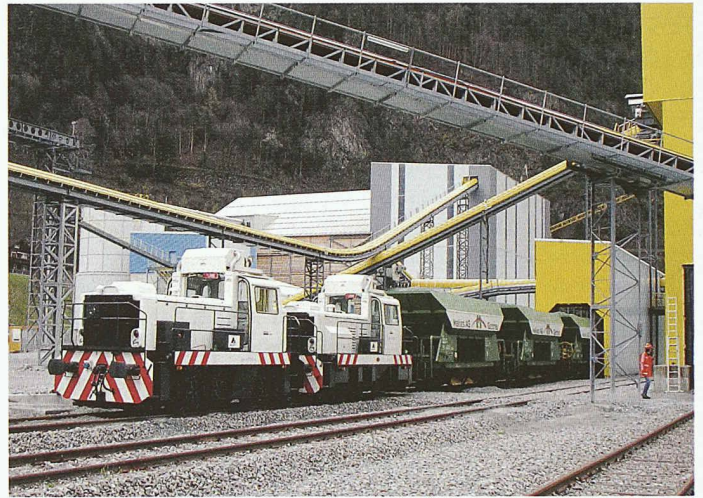
Nicht nur der eigentliche Tunnelbau, auch die Logistik ist eine beachtliche Leistung

Ein bautechnisches und architektonisches Schmuckstück ist zweifellos das neue, zweigeschossige, von Palmen gezielte Gebäude des aus Tunnelausbruchmaterial, Stahl und Glas bestehenden Besucherzentrums am Südportal zwischen Pollegio und Bodio. Es ist das Werk des Architektenteams Bauzeit GmbH, Biel, das als Sieger aus einem internationalen Wettbewerb hervorgegangen war. Die Gebäudehülle, als Sinnbild des zu durchdringenden Berges, besteht aus Ausbruchmaterial mit Korngrössen von 100 bis 150 mm, abgefüllt in Steinkörben und örtlich verstärkt durch meist unsichtbare Stahlbetonelemente. Die leichte, filigrane Stahlkonstruktion im Innern ergibt zusammen mit den klimatisch bedingten Glaswänden eine gelungene Komposition und bildet mit der multimedialen Technik der Ausstellung eine Einheit.