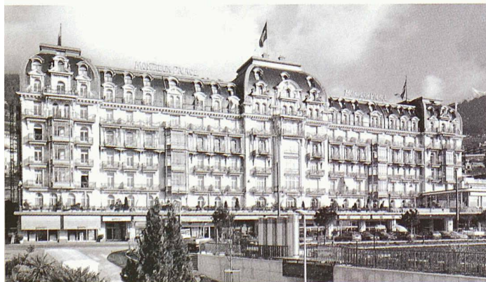
Hotel «Montreux-Palace», Prunkstück aus der Belle Epoque, dem goldenen Zeitalter des Tourismus. Die 250-Betten-Burg wurde 1904–06 vom Lausanner Architekt Eugène Jost in nur 22 Monaten gebaut