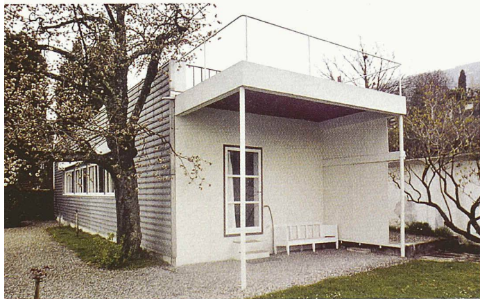
Die Villa Le Lac in Corseaux bei Vevey, die Le Corbusier 1922/23 für seine Eltern baute. Die «Schachtel auf dem Boden» (Le Corbusier) ist nur 2,50 m hoch und 60 m 2 gross

( rzw/pd ) In der vom Schweizer Heimatschutz lancierten Reihe «Baukultur entdecken» ist die dritte Broschüre erschienen. Das Faltblatt stellt 21 Bauzeugen in der Region Montreux - Vevey vor und ist wie schon bei Arosa und Mürren sorgfältig recherchiert und ansprechend gestaltet. Der Rundgang führt zu herrschaftlichen Anwesen aus dem 18. Jh., Hotelpalästen der Belle Epoque, Villen von Le Corbusier und Adolf Loos und zu Hochhäusern und Konzernsitzen der Nachkriegsmoderne. Gratis bei: Schweizer Heimatschutz, Postfach, 8032 Zürich, www.heimatschutz.ch