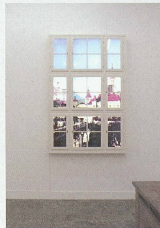
Von links: Objekte von Marjetica Potrc und Brian Tolle