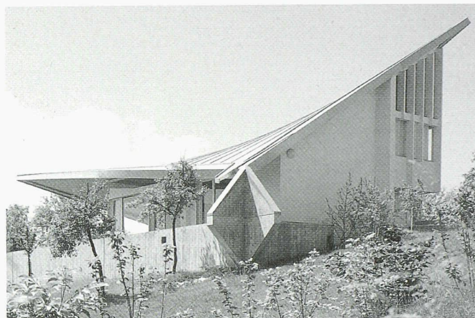
Das Haus Antoinette Vischer, 1961, Hegenheim (F), von Felix Schwarz und Rolf Gutmann, mit hyperbolischem Paraboloiddach; unten ihr Stadttheater Basel von 1969–75 (Bilder: Schwarz und Gutmann)