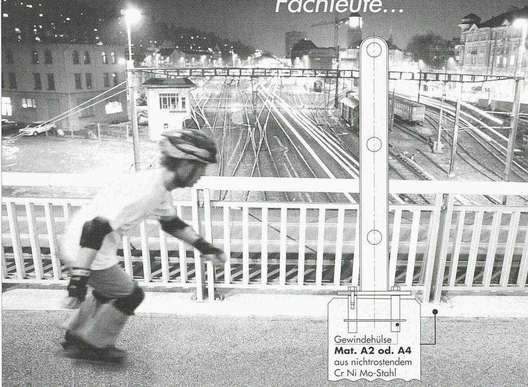
Gewindehülse Mat. A2 od. A4 aus nichtrostendem Cr Ni Mo-Stahl