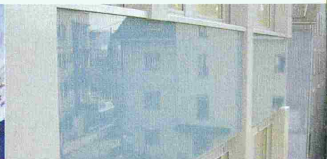
Raffinierte Optik, erzeugt durch die glatte, ästhetische Fassadenoberfläche

Verdeckte und wirtschaftliche Montage der Glas-Fassadenplatten durch Verkleben eines Einhängesystems in der Vorfabrikation mit SikaTack-Panel.