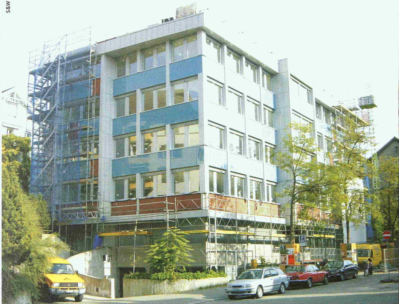
Geschäftshaus Hänggerstrasse, Zürich