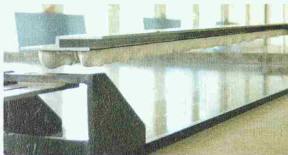
Verklebung des Einhängesystems auf die Plattenrückseite in der Vorfabrikation

Wo geklebt und gestaltet wird – sind wir dabei