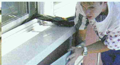
Schnelle Montage durch das einfache Einhängen der Glasplatten auf der Baustelle