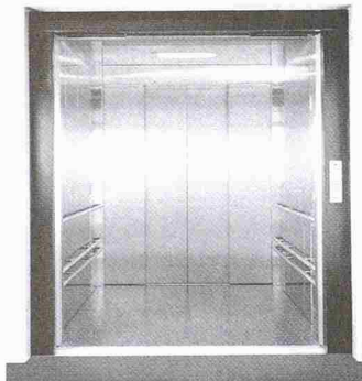
Kabine des maschinenraumlosen Aufzugsystems Lexa

AS Aufzüge AG 9016 St. Gallen 071 282 11 48, Fax 071 282 11 02 www.lift.ch