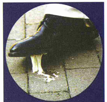
Müheloses Entfernen selbst von Kaugummis, um solch unliebsame Ereignisse zu verhindern

Desax 8737 Gommiswald 055 290 15 20, Fax 055 290 15 21 www.graffiti-schutz.ch