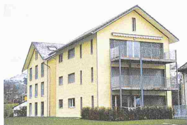
Überbauung Ziel in Appenzell; Fassade: System Outdoor-Top

Granit Systems SA 1003 Lausanne 021 323 58 15, Fax 021 323 58 19 www.granit-environment.com