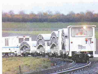
Transportlogistik des Projektes Westerschelde-Tunnel; ca. 40 000 Zugbewegungen mit 20 Loks

Die europaweit tätige deutsche Firmengruppe Dibora aus Germendorf bei Berlin hat Amsteg als Sitz