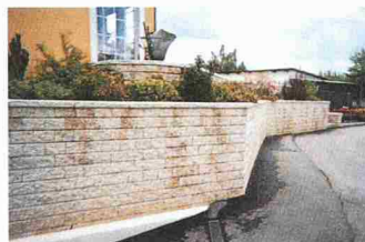
Garten- und Stützmauer Leromur

System für senkrechte und geneigte Stützmauern sowie frei stehende Begrenzungsmauern. Die Elemente von 100 cm Länge können vor