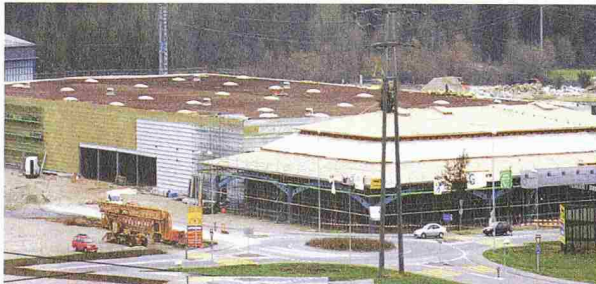
Baumarkt Hornbach AG; Architekten: Fugazza, Steinmann & Partner AG, Wettingen

Die Bauherrschaft, Planer und Unternehmer haben sich beim ersten schweizerischen Hornbach-Baumarkt in Littau für ein Sarnafil-T-Dachsystem mit Sarnavert-Begrünung entschieden. Das Dach