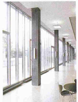
Die filigranen Stützen fördern die Transparenz des Gebäudes; Interkantonales Technikum Rapperswil

Durch den Herstellungsprozess wird der Beton so stark verdichtet, dass im Verhältnis zum Durchmesser überdurchschnittlich tragfähige Betonfertigteile entstehen, die sehr schlank wirken. Dies eröffnet dem Architekten und Planer Freiraum bei der Umsetzung innovativer