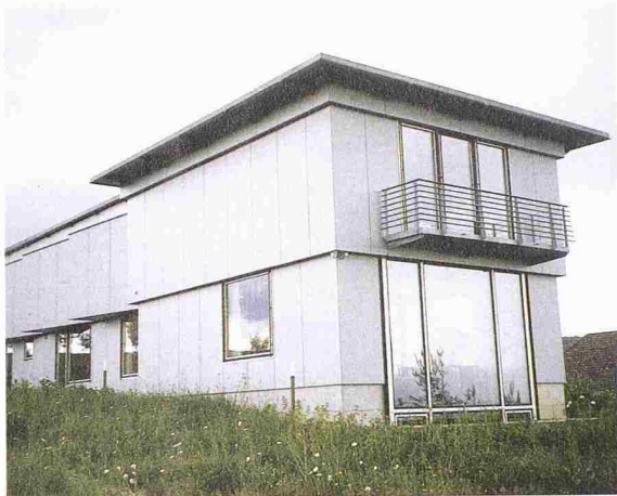
Gute Objekte kommunizieren sich manchmal von selbst. Doch es lohnt sich, durch gezielte Massnahmen nachzuhelfen. Wohnhaus in Däniken. Architekt: Ueli Zbinden

und dosiert vorzugehen. Nur wer sich immer wieder und bei verschiedenen Gelegenheiten zu Wort meldet, wird nicht vergessen.