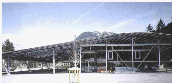
Erich Gutmorgeth, Lebensmittelsupermarkt Mpreis, Leutasch, Tirol (1998–99)

Die Ausstellung dauert noch bis 15.4.02 und ist täglich von 10 bis 19 h geöffnet.