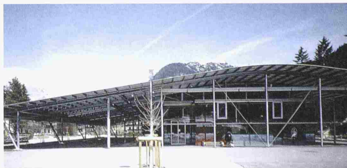
Erich Gutmorgeth, Lebensmittelsupermarkt Mpreis, Leutasch, Tirol (1998–99)

Die Ausstellung dauert noch bis 15.4.02 und ist täglich von 10 bis 19h geöffnet.