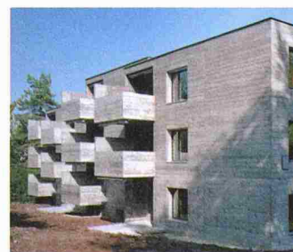
Mehrfamilienhäuser Wasserschöpfli 75/77, Zürich, ursprüngliches Baujahr 1968. Architekt Fritz Schwarz, Sanierung Galli und Rudolf, 2001