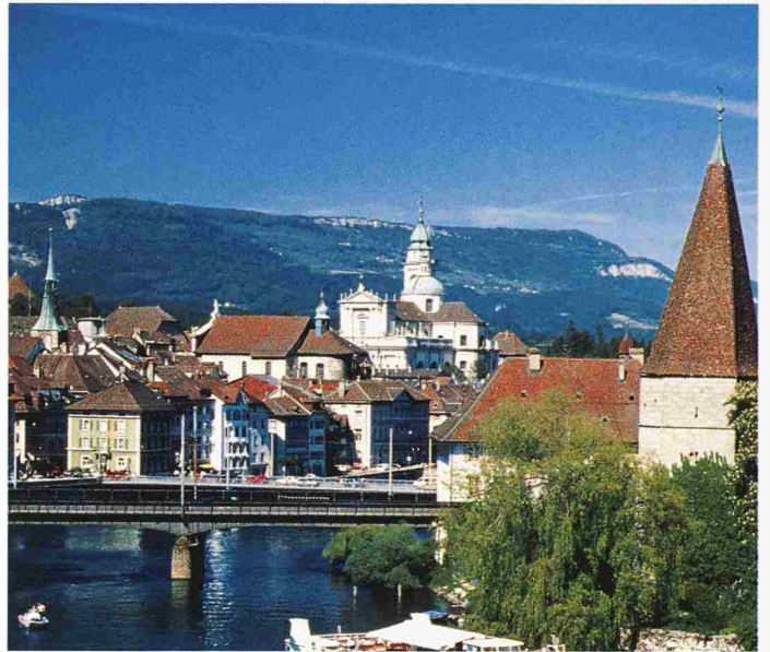
Die Delegierten des SIA tagten in der vom Barock geprägten Stadt Solothurn. Im Vordergrund rechts der Krümme Turm, auf dem gegenüberliegenden Aareufer die Kathedrale St. Ursen, die Jesuitenkirche, ganz links der Zitglockenturm und dazwischen das Alte Zeughaus (mit dem grossen Krüppelwalmdach) mit seiner eindrücklichen Sammlung von 400 Harnischen

Nach eingehender Diskussion wurden das Budget 2003 – ein Voranschlag mit einer «schwarzen Null» – und der Bericht der Rechnungsprüfungskommission angenommen. Die Mitgliederbeiträge bleiben auch 2003 unverändert. Die höheren Aufwendungen für zusätzliche Aufgaben sollen durch höhere Einnahmen aus neuen Produkten gedeckt werden. Aus der «vertikalen Öffnung» des SIA gegenüber Fachhochschulen dürften die