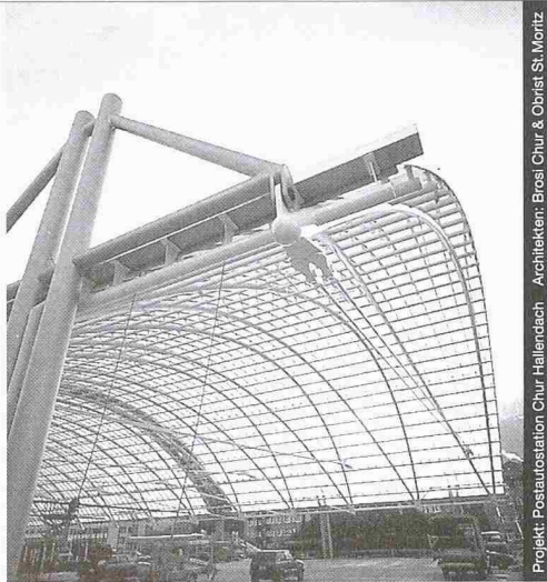
Projekt: Postautostation Chur-Hallendach Architekten: Brosi Chur & Obrist St. Moritz

Stahl-Glas-Konstruktionen in architektonisch perfekter Vollendung verwirklichen wir mit innovativen Ideen und höchsten Anforderungen an Materialien und Ausführung.