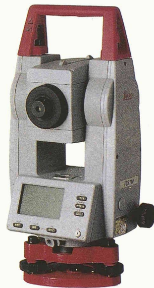
Leica TPS 100 Serie, entwickelt für Gebäude- und Tiefbauvermessungen

Leica Geosystems stellt ihre neue kostengünstige und leistungsfähige Bautachymeterreihe, die TPS 100 Series vor. Damit setzt Leica Geosystems neue Massstäbe in der Bauvermessung. Die Tachymeterreihe ist speziell für Baustellen entwickelt. Sie zeichnet sich durch einfache Handhabung und einen hohen Zeitgewinn für den Anwender aus. Herausragend ist das integrierte Messsystem mit Infrarot- und Laser-Messtechnik. Damit ermöglichen die TPS 100 Instrumente nicht nur Winkelmessungen, sondern auch Distanzmes-