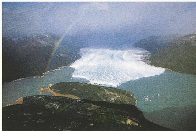
Perito-Moreno-Gletscher, Patagonien (links)

Die Websites www.3sat.de und www.swr2.de halten neben den Programangaben weitere Informationen und Links zu Frisch (auch als Architekt) bereit.