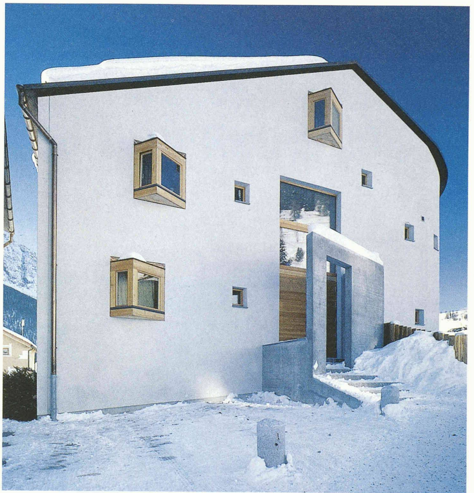
Erker und Tor als gestalterische Reaktion auf den Zwang zum Schutz, Mehrfamilienhaus, Zuoz (Pfister Schiess Tropeano und Partner AG)

einem seitlich offenen Vorbau in Beton geschützt. Vor die alten Fensteröffnungen im Erdgeschoss wurden in einem Abstand von 10 cm Scheiben montiert, so dass die Fenster trotzdem weiterhin zu öffnen sind. Bei einer Breite von 138 cm und einer Höhe von 286 cm waren Panzergläser von 20 mm Dicke erforderlich.