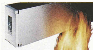
Mehr Sicherheit im Brandfall mit feuerwiderstandsfähigem Installationskanal-System FWK

Wenn in den Medien von Brandkatastrophen berichtet wird, stellt sich in der Öffentlichkeit häufig die Frage nach der technischen Schutzausstattung der betroffenen Gebäude. Überall dort, wo viele Menschen zusammenkommen, sind Lösungen für die Elektroinstallation erforderlich, die den Anforderungen des vorbeugenden Brandschutzes gerecht werden. Geeignete Systeme können im Ernstfall wesentlich zur Rettung von Leben beitragen. Für den Schutz elektrischer Leitungen entlang von Flucht- und Rettungswegen gibt es von Tehalit das feuerwiderstandsfähige Installationskanal-System FWK. Das Programm wurde in Zusammenarbeit mit Experten und Behörden entwickelt und entspricht den Bestimmungen und Normen des vorbeugenden Brandschutzes. Im Brandfall verlängert es die Funk-