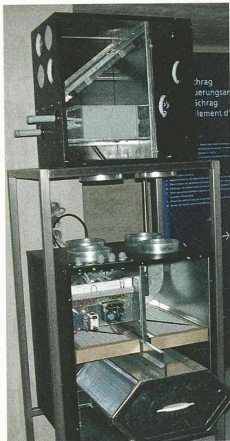
Die Lüfterneuerungsanlage «System Schrag» saugt Luft aus belasteten Räumen (Küche, Bad und WC), und führt angewärmte Frischluft in Schlaf-, Wohn- und Kinderzimmer