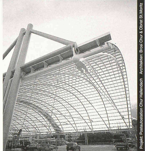
Projekt: Postautostation Chur Hallendach Architekten: Prosi Chur & Obrist St.Moritz

Stahl-Glas-Konstruktionen in architektonisch perfekter Vollendung verwirklichen wir mit innovativen Ideen und höchsten Anforderungen an Materialien und Ausführung.