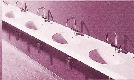
im Sanitärbereich öffentlicher Bauten

VARI-COR® lässt anspruchsvolle Innenraumgestaltung leben. Ein vielseitiger High Tech Mineralwerkstoff für exklusive, hochwertige, moderne und farbenprächtige Lösungen. Flexibel in der Planung. Einfach in der Verarbeitung. Praktisch im täglichen Gebrauch. VARI-COR® findet in den verschiedensten Segmenten Anwendung, z.B.