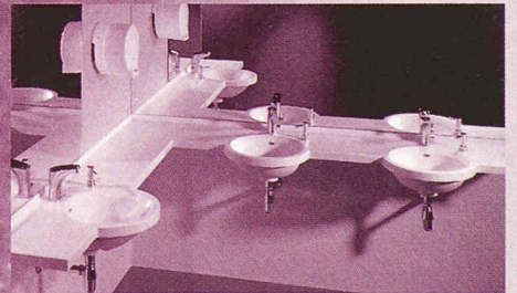
in Badezimmern von Eigenheimen und Hotels