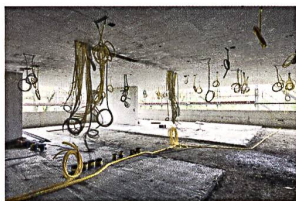
Nur nicht den Überblick verlieren! Die Gebäudetechnik wird immer aufwendiger. Sind wir noch auf dem richtigen Weg?