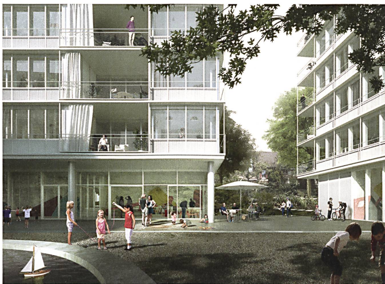
Die lockere Anordnung der Gebäude beim Projekt «Zelena» von EM2N Architekten und Balliana Schubert Landschaftsarchitekten wirkt leicht und luftig.

D ie Wohn- und Siedlungsgenossenschaft Zürich (wsgz), gegründet 1944, bewirtschaftet über tausend Wohnungen im Grossraum Zürich. Ihr gehören die Gebäude aus den 1950er-Jahren zwischen Tannenrauchstrasse und Mutschellenstrasse in Zürich Wollishofen. Sie entsprechen nicht mehr den heutigen Bedürfnissen, aber eine Modernisierung wäre wegen der Struktur und des baulichen Zustands mit unverhältnismässigem Aufwand verbunden. Die Genossenschaft hat deshalb beschlossen, die Gebäude durch Neubauten zu ersetzen. Auf dem Areal sollen ungefähr 100 Wohnungen im mittleren Preissegment entstehen. Besonderes Augenmerk legt die Ausloberin auf einen Aussenraum von hoher Qualität.