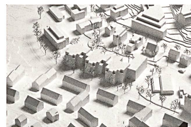
3. Rang: «Haus am Garten», von Adrian Streich Architekten mit Ganz Landschaftsarchitekten.