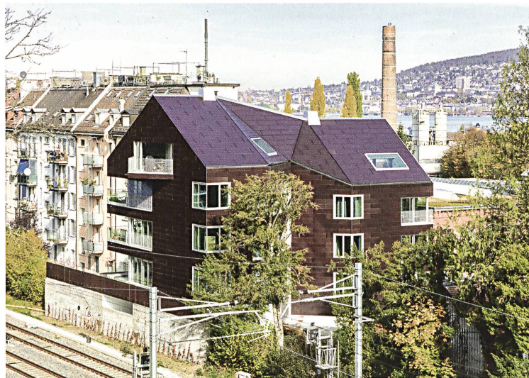
Haus Solaris, Zürich 2017. Unsichtbar mit Photovoltaikzellen hinterlegte Elemente aus profiliertem Gussglas bilden eine All-over-Hülle, die Strom produziert.