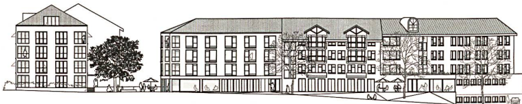
1. Rang: «La Vie En Rose», ARGE Rahbaran Hürzeler Architekten, Ansicht, Mst. 1:1300.

Auch die Innenräume sind mit der Umgebung vernetzt. Der Aussenraum der Cafeteria orientiert sich zum Bach gegen Osten, während der Essraum gegen Westen zu den