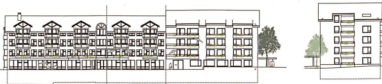
2. Rang: «Hilo», Dettling Wullschlegler Architekten, Ansicht, Mst. 1:1300.