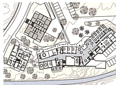
3. Rang: «Arco», Grundriss EG, Mst. 1:2500.

Arkaden und zum «Marktplatz» gerichtet ist. Die Zimmer im Alters- und Pflegeheim verfügen über grosszügige Gemeinschaftsbalkone. Die Alterswohnungen hingegen haben eigene Loggien in den Gebäudeecken. Die verputzten Lochfassaden fügen sich geschickt in die bestehende Architektur ein, ohne sich aufzudrängen. Die hohen Fensteröffnungen bieten auch im Sitzen einen Blick in die nähere Umgebung.