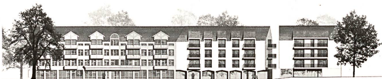
3. Rang: «Arco», fsp architekten, Ansicht, Mst. 1:1300.