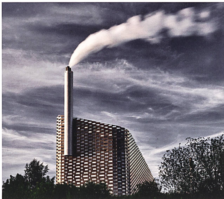
Eine netzartig wirkende Fassade umkleidet das Amager Ressource Center.