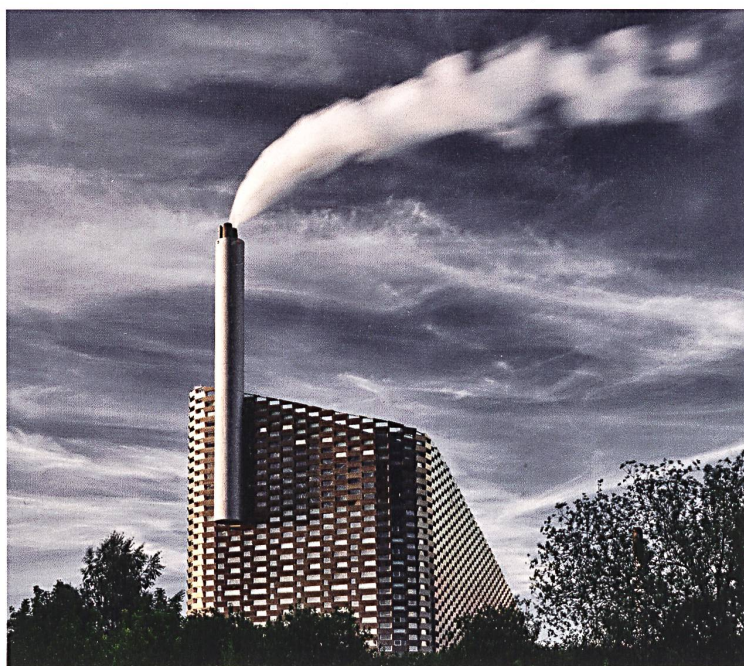
Eine netzartig wirkende Fassade umkleidet das Amager Ressource Center.