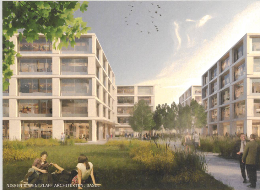
Bürogebäude für die Konzern-IT der Roche, Kaiseraugst AG