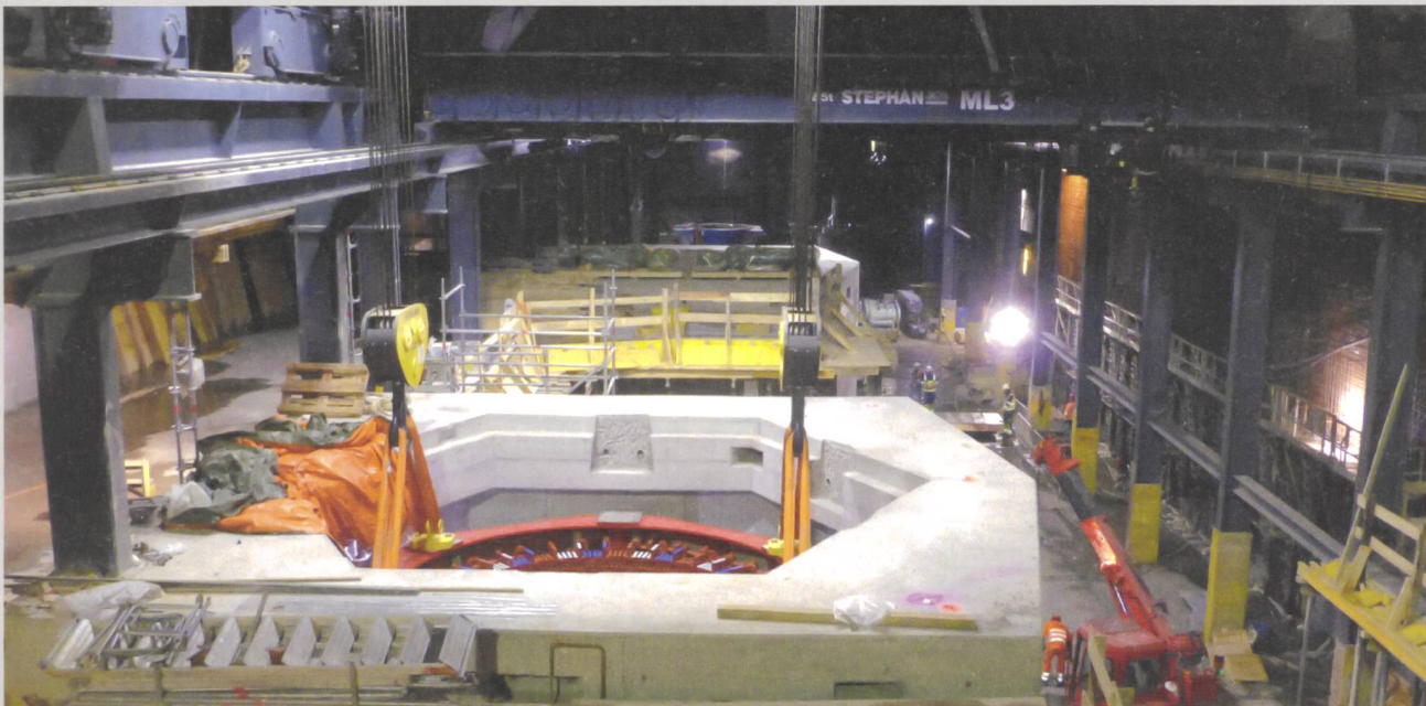
Pumpspeicherkraftwerk Veytaux VD

Überzeugen Sie sich selbst und bewerben Sie sich noch heute für eine Stelle bei der Emch+Berger Gruppe.