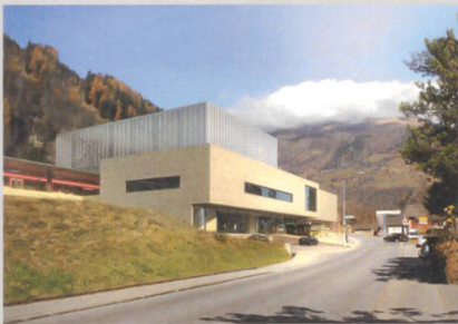
Oben: Bahnhofplatz Interlaken West BE Unten: ÖV-Hub Fiesch VS