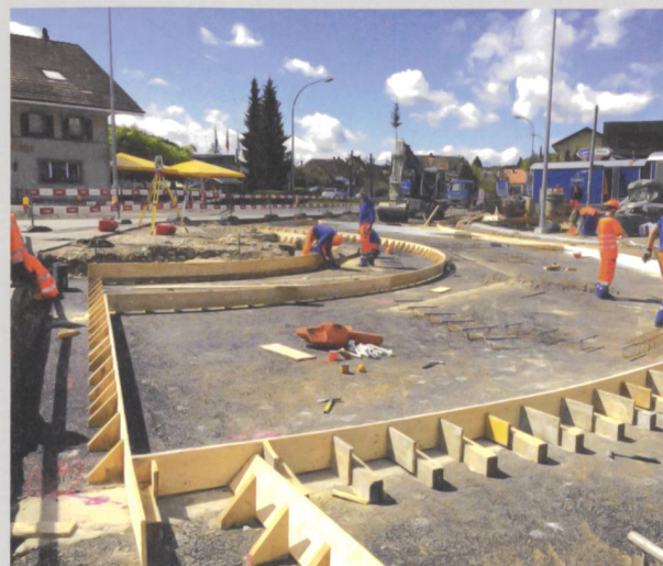
Ausbau Kantonstrasse Vorderwald AG

Begeisterung, Engagement und Verantwortungsbewusstsein zeichnen unsere Mitarbeitenden aus, welche in interdisziplinären Teams für unsere Kunden in der ganzen Schweiz arbeiten. Emch + Berger gehört vollständig den Mitarbeitenden. Das macht uns nicht nur unabhängig, sondern spornt uns auch täglich zu Höchstleistungen an.