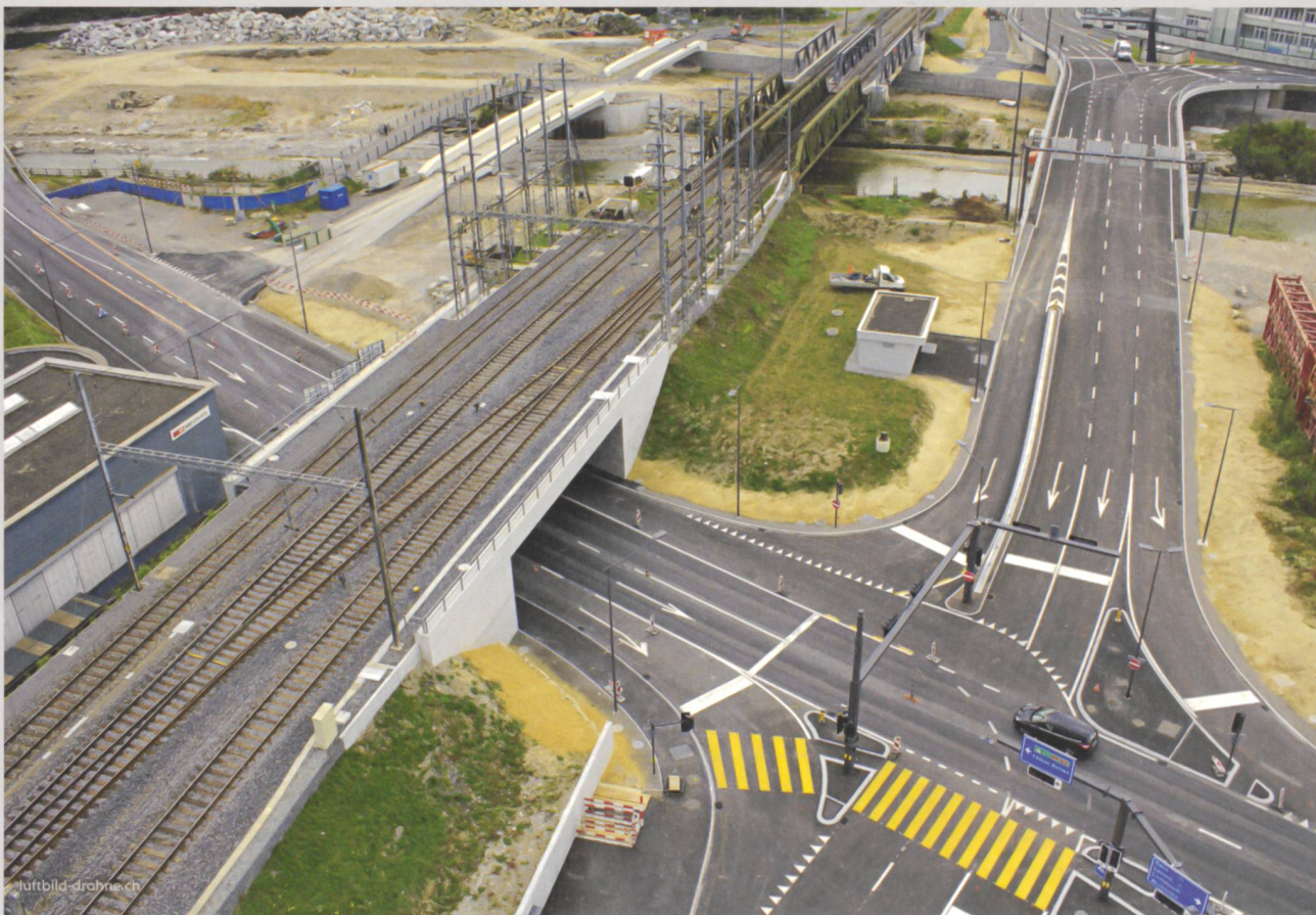
Gesamterneuerung Seetalplatz LU

Seit 1953 bieten wir eine breite Palette von Planungs-, Beratungs- und Managementleistungen für sämtliche Projektphasen in den Bereichen Infrastruktur, Immobilien, Umwelt, Energie und Vermessung an. Mit 610 Mitarbeitenden an 25 Standorten sind wir national präsent und nahe bei unseren Kunden.