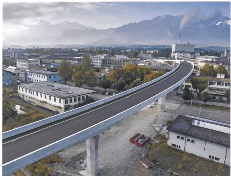
Südlicher Teil der neuen Aarebrücke , des Herzstücks des Bypass Thun Nord.