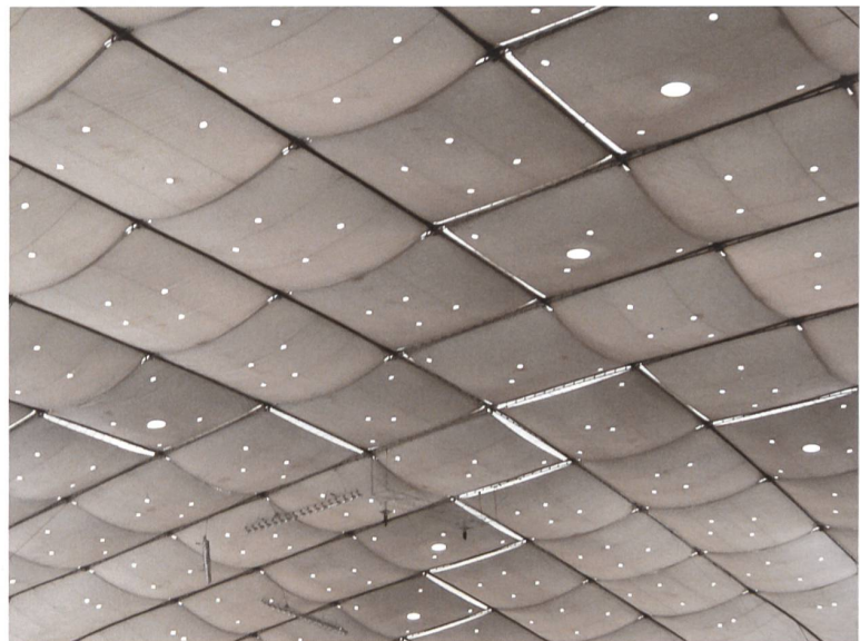
Das Dach des 2014 abgerissenen Metrodome in Minneapolis, einer Traglufthalle.