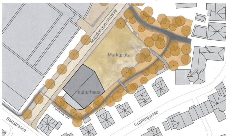
Kompaktes Volumen, offener Platz und naturnahe Gewässer, Mettler Landschaftsarchitektur und Geisser Streule Inhelder Architekten. Mst. 1:1500.

Nur online: Weitere Infos und Bilder finden Sie auf www.espazium.ch/markt-flawil