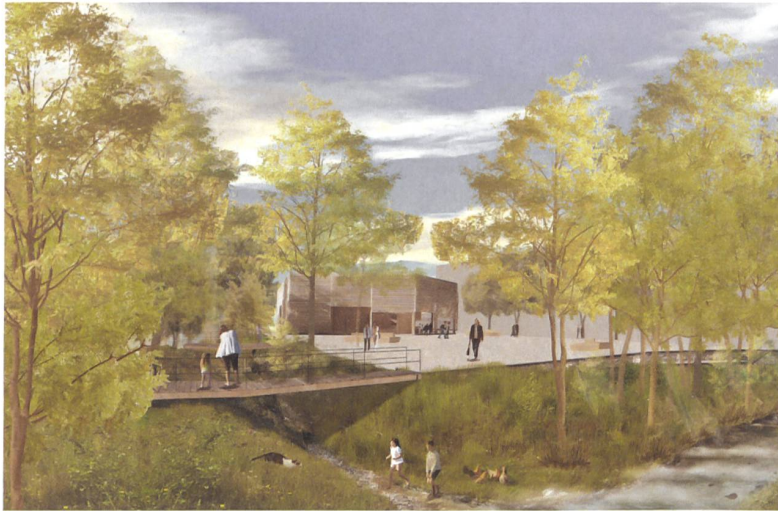
Leere Mitte: Mettler Landschaftsarchitektur und Geisser Streule Inhelder Architekten.

und der Platz ist doch klar gefasst. Zwei Fussgängerbrücken verbinden den Marktplatz mit den angrenzenden Dorfteilen. Konsequenterweise wird auf eine Bepflanzung der Tiefgarage mit Bäumen verzichtet. Die naturnahe Gestaltung der Gewässer kann aber angesichts der geringen Wassermengen, der beachtlichen Höhenunterschiede und der dafür erforderlichen aufwendigen baulichen Massnahmen nicht überzeugen.