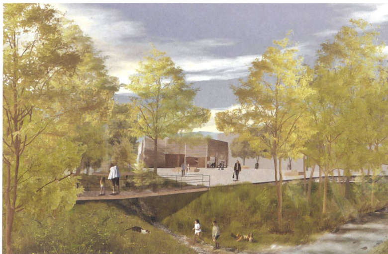
Leere Mitte: Mettler Landschaftsarchitektur und Geisser Streule Inhelder Architekten.

und der Platz ist doch klar gefasst. Zwei Fussgängerbrücken verbinden den Marktplatz mit den angrenzenden Dorfteilen. Konsequenterweise wird auf eine Bepflanzung der Tiefgarage mit Bäumen verzichtet. Die naturnahe Gestaltung der Gewässer kann aber angesichts der geringen Wassermengen, der beachtlichen Höhenunterschiede und der dafür erforderlichen aufwendigen baulichen Massnahmen nicht überzeugen.