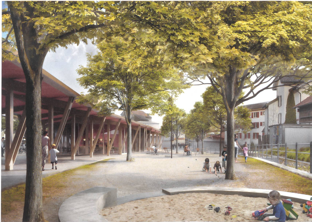
Bebautes Zentrum , Schmid Landschaftsarchitektur mit Esch Sintzel Architekten.

Z u den wichtigsten sehenswerten Baudenkmälern in Flawil zählen das Alte Rathaus, der Gasthof Hirschen sowie die evangelische und die katholische Kirche. Der Marktplatz gehört definitiv nicht dazu. Er wird als Autoabstellplatz und Entsorgungsstandort genutzt. Die viergeschossigen Gebäude der Migros im Westen und der Raiffeisenbank im Norden bestimmen die unmittelbare Umgebung. Die Bebauung entlang der Gupfengasse mit Stickerhäusern ist dagegen eher kleinstädtisch. Um den Marktplatz aus seinem Dornröschenschlaf zu wecken, hat die Gemeinde verschiedene Rahmenbedingungen für eine neue Nutzung