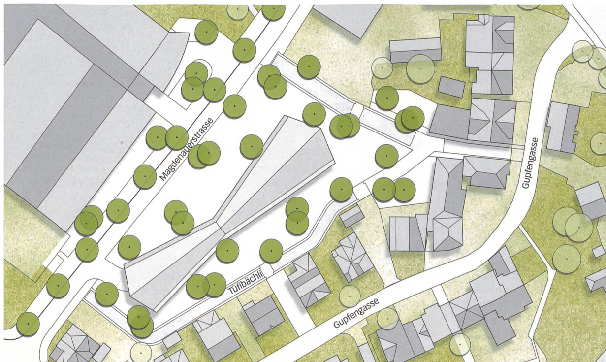
Grosses Dach, Baumhain und kanalisierte Bäche, Schmid Landschaftsarchitektur mit Esch Sintzel Architekten. Mst. 1 : 1000.

Einen anderen Ansatz verfolgen Mettler Landschaftsarchitektur und Geisser Streule Inhelder Architekten. Ihr grosses Thema ist die Offenlegung der Bäche. Sie gestalten die Bachböschungen naturnah und bepflanzen sie locker mit einheimischen Baumarten. So bleiben Durchblicke zum angrenzenden Quartier,